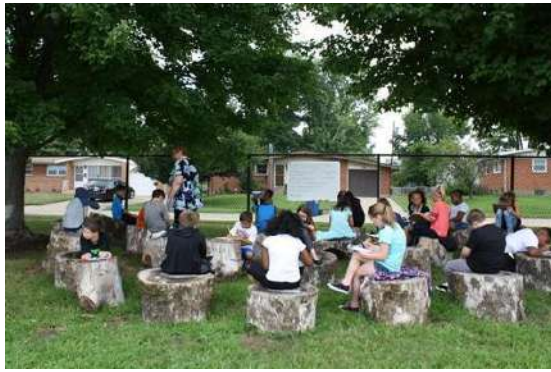
ritenour school district