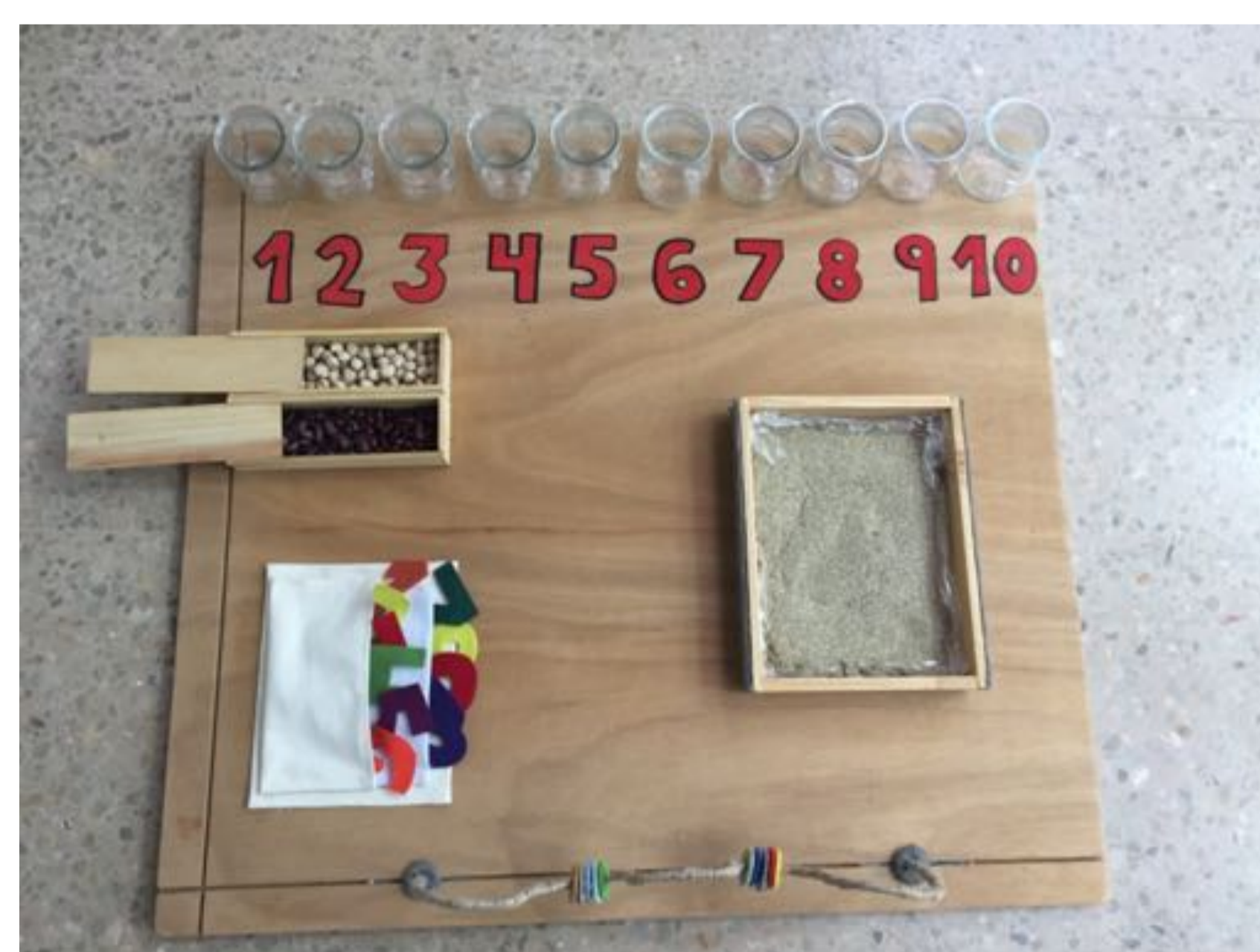
TAULER LÒGIC MATEMÀTIC. Referents: mètode de la intuïció (forma, número i paraula) de Pestalozzi i la seva concepció naturalista de l'educació. Montessori, utilitzant objectes reals (com llavors, sorra o llegums) i permet l'autocorrecció i infinits intents