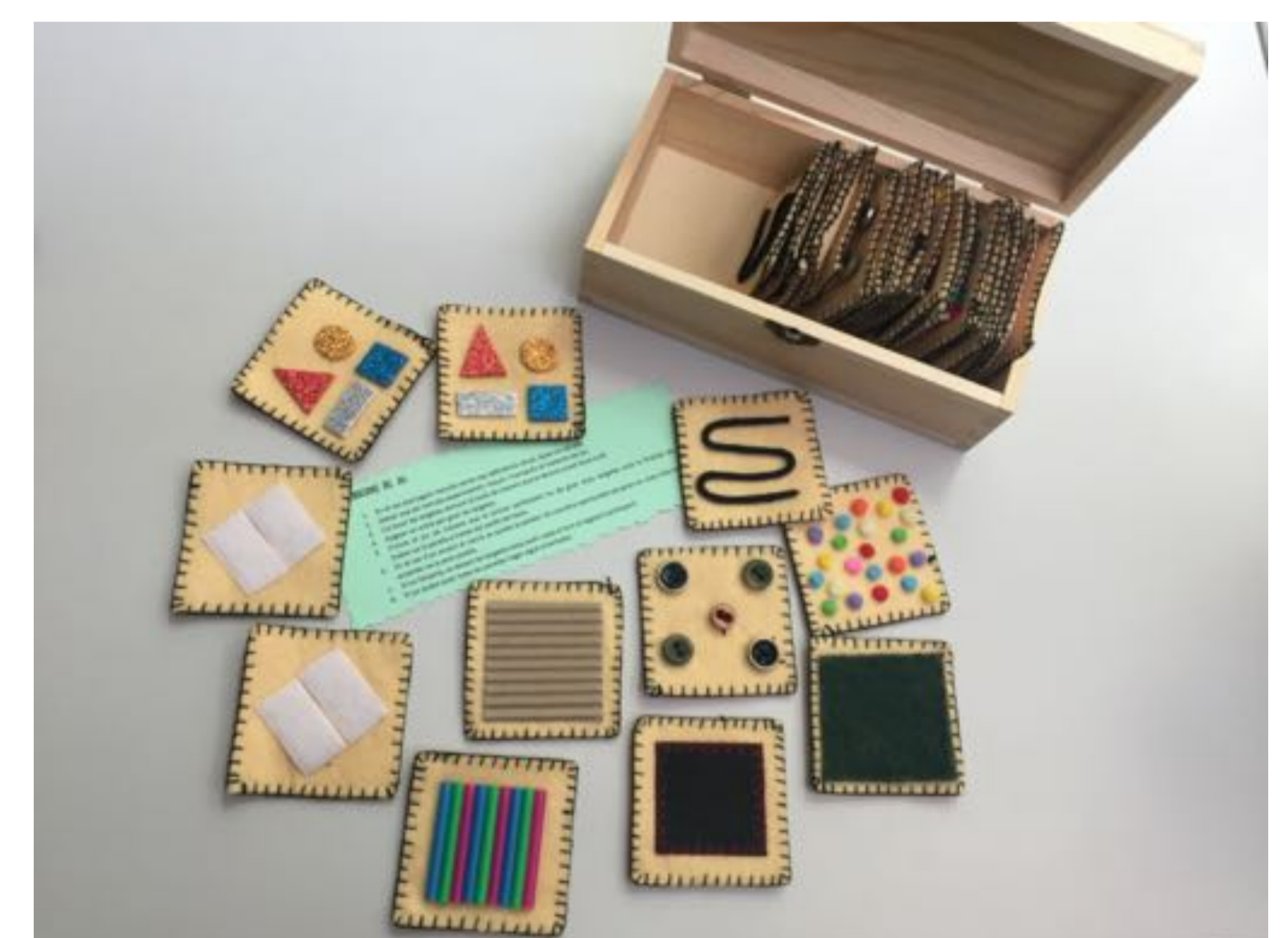
TROBA LA PARELLA. Joc creat amb tela i diferents materials amb distintes propietats. Treballa amb el sentit del tacte per a la discriminació sensorial. Inspiració en conceptes propis de les propostes realitzades per Froebel i Montessori