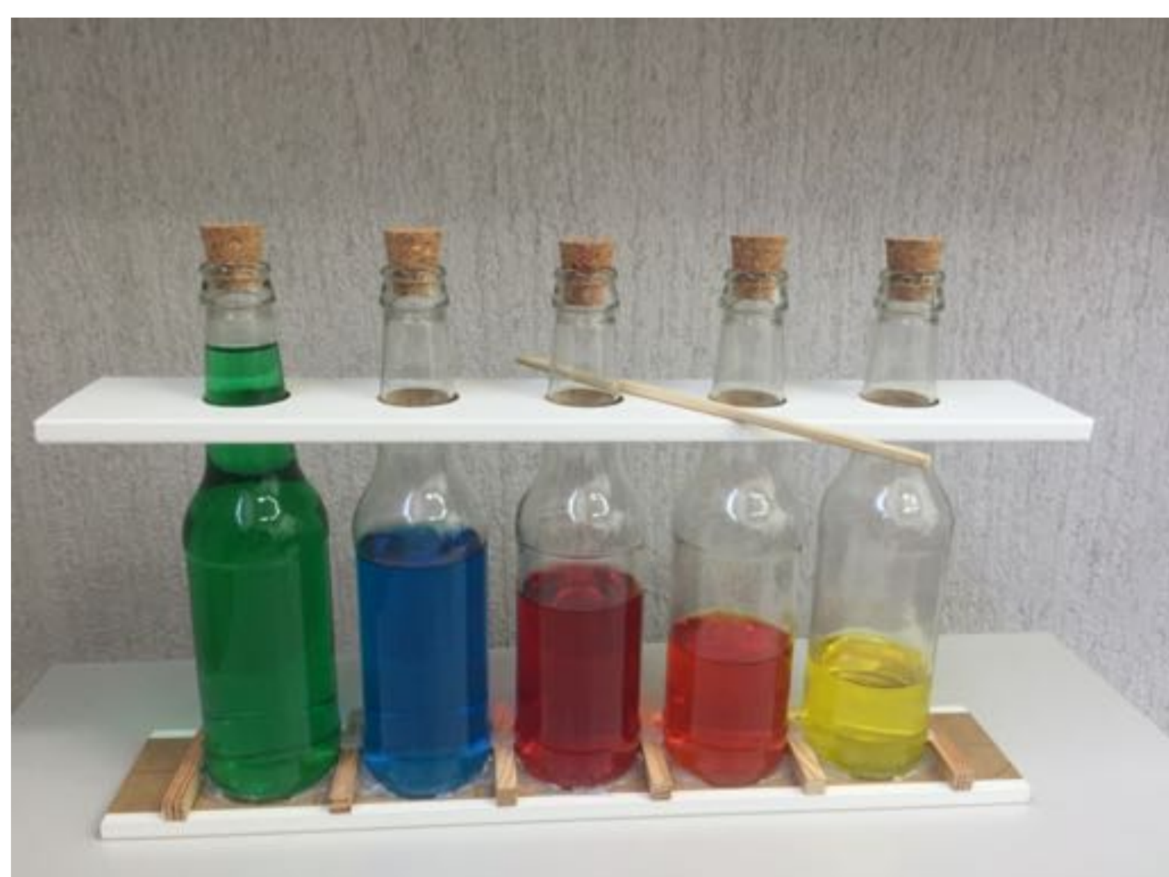
XILÒFON: elaborat a partir dels plantejaments de la filosofia de Reggio Emilia i la pedagogia Waldorf