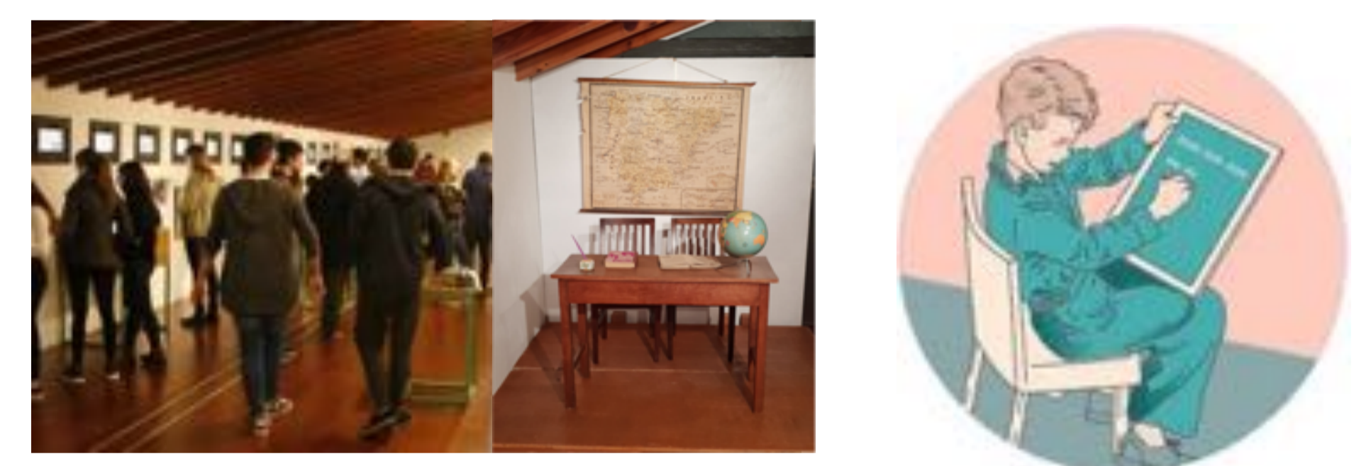
EXPOSICIÓ "L'ESCOLA: DESCOBRIR, FER I CONVIURE" (Claustre de Sant Domingo, Inca, del 9 de novembre al 7 de desembre)