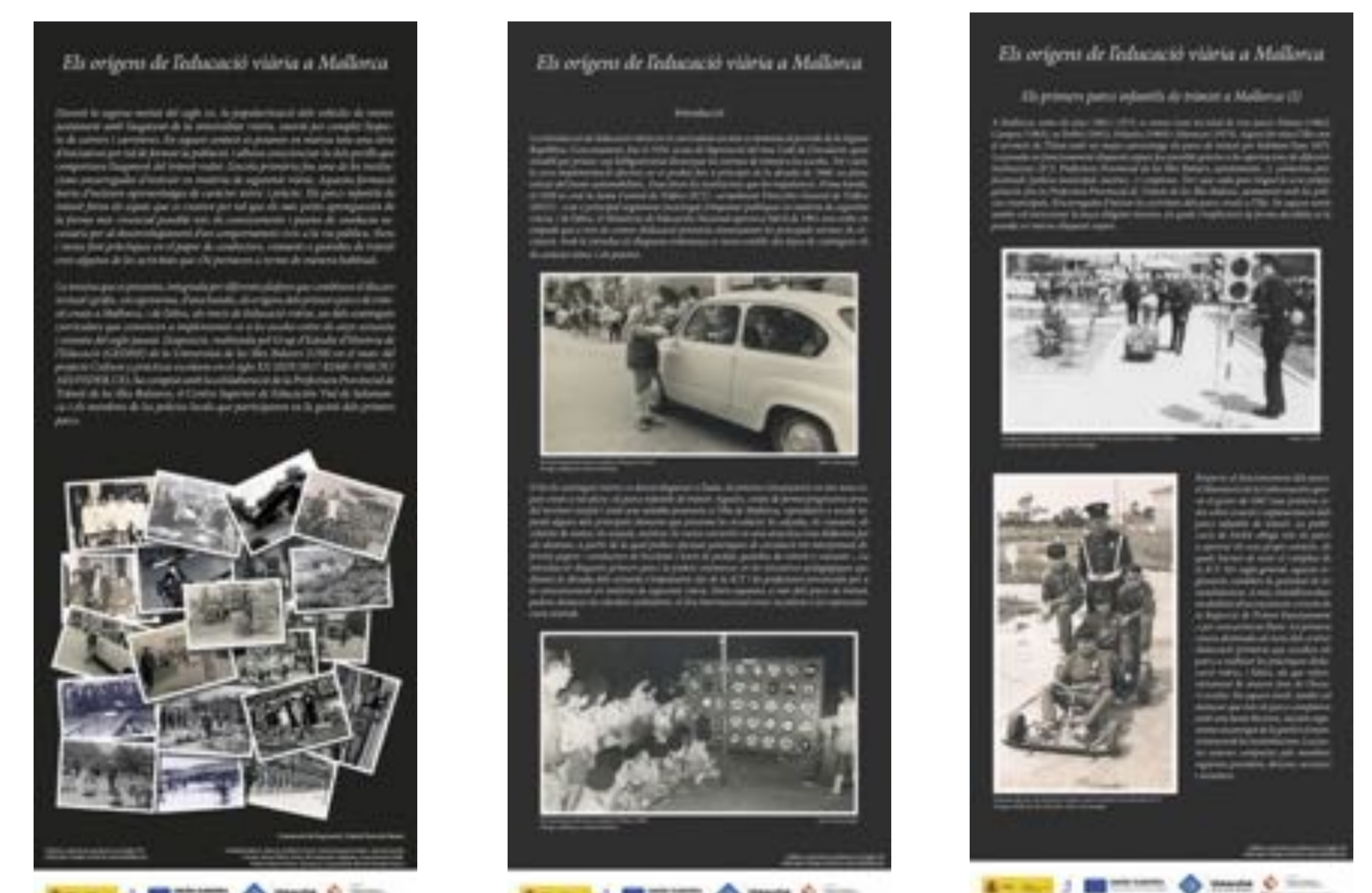
EXPOSICIÓ "ELS ORÍGENS DE L'EDUCACIÓ VIÀRIA A MALLORCA" https://gedhe.uib.cat/Exposicions/educacio-vial/