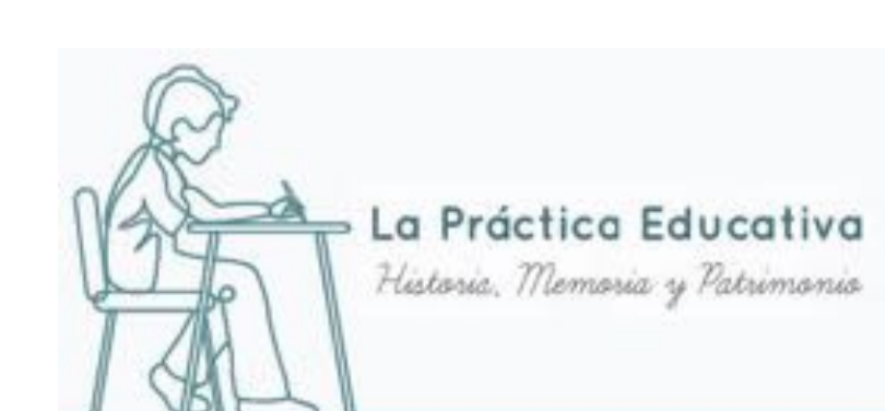
VIII JORNADAS CIENTÍFICAS DE LA SEPHE - I CONGRESO NACIONAL DE LA SIPSE (Palma, del 20 al 23 de novembre)