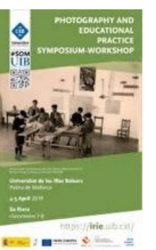
WORKSHOP "PHOTOGRAPHY AND EDUCATIONAL PRACTICE" (Palma, 4 i 5 de d'abril de 2019)